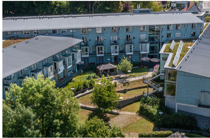
Die Räumlichkeiten der Tagespflege in unserem Seniorenzentrum bieten einen atemberaubenden Ausblick über die Stadt in einer gemütlichen Atmosphäre.

Wir nehmen uns Zeit für Sie! Besonderen Wert legen wir auf eine persönliche und liebevolle Betreuung - unsere erfahrenen Mitarbeiterinnen und Mitarbeiter kümmern sich individuell um jeden einzelnen Gast. Wenn es erforderlich ist, übernehmen wir auch die notwendige Behandlungspflege nach ärztlicher Verordnung, z. B. Medikamentengabe. Weitere pflegerische Unterstützung können Sie auf Anfrage bei unserem ambulanten Pflegedienst erhalten.