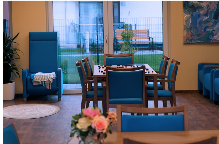
Räumlichkeiten der Tagespflege In einer gemütlichen Atmosphäre wird gemeinsam gelacht, gespielt und geruht.

Wir nehmen uns Zeit für Sie! Besonderen Wert legen wir auf eine persönliche und liebevolle Betreuung - unsere erfahrenen Mitarbeiterinnen und Mitarbeiter kümmern sich individuell um jeden einzelnen Gast. Wenn es erforderlich ist, übernehmen wir auch die notwendige Behandlungspflege nach ärztlicher Verordnung, z. B. Medikamentengabe. Weitere pflegerische Unterstützung können Sie auf Anfrage bei unserem ambulanten Pflegedienst erhalten.