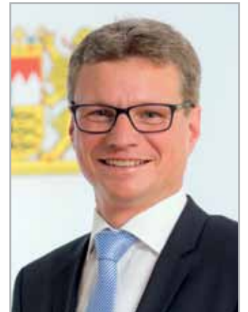
Vorsitzender Bernd Sibler, Mdl

Dank sei auch gesagt, den Ämtern und Behörden, den Firmen und der Presse, vor allem aber der Bevölkerung, die durch ihr Wohlwollen und ihre Aufgeschlossenheit mitgeholfen haben, die vielseitigen Aufgaben des Roten Kreuzes zu unterstützen.