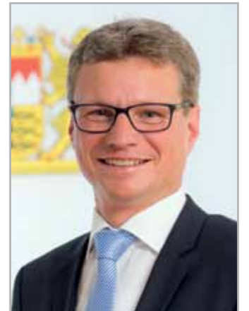
Vorsitzender Bernd Sibler, Staatsminister

Dank sei auch gesagt den Ämtern und Behörden, den Firmen und der Presse, vor allem aber der Bevölkerung, die durch ihr Wohlwollen und ihre Aufgeschlossenheit mitgeholfen haben, die vielseitigen Aufgaben des Roten Kreuzes zu unterstützen.