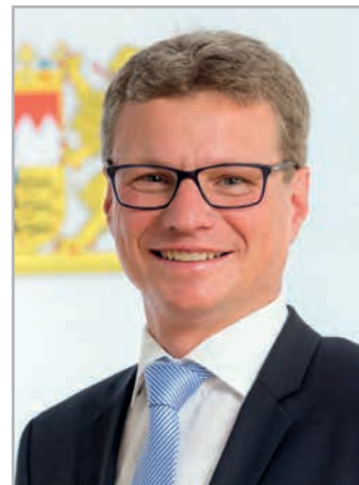
Vorsitzender Bernd Sibler, Staatsminister

Dank sei auch gesagt den Ämtern und Behörden, den Firmen und der Presse, vor allem aber der Bevölkerung, die durch ihr Wohlwollen und ihre Aufgeschlossenheit mitgeholfen haben, die vielseitigen Aufgaben des Roten Kreuzes zu unterstützen.