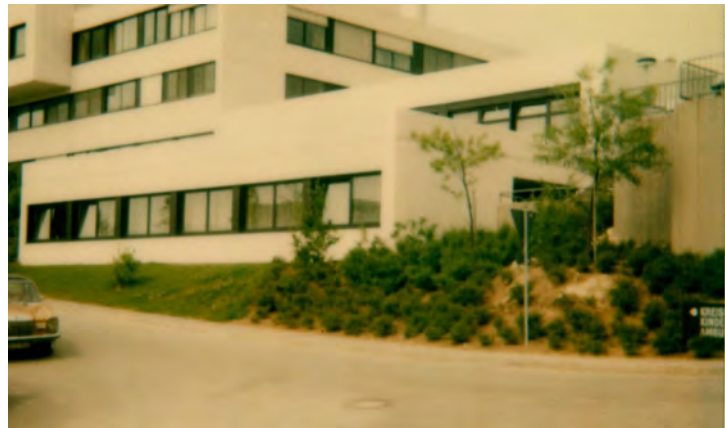
BRK Kreisverband am Standort Perlasberger Str. 39 am Klinikum im Jahr 1985