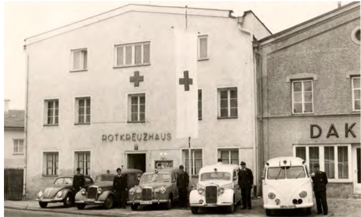
BRK Kreisverband am Standort Graflinger Str. 6 im Jahr 1959